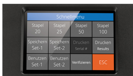
Hochauflösendem Touchscreen mit mehrsprachiger Benutzeroberfläche und Schnellmenü