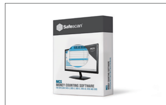
Safescan MCS Software Art.no: 124-0500