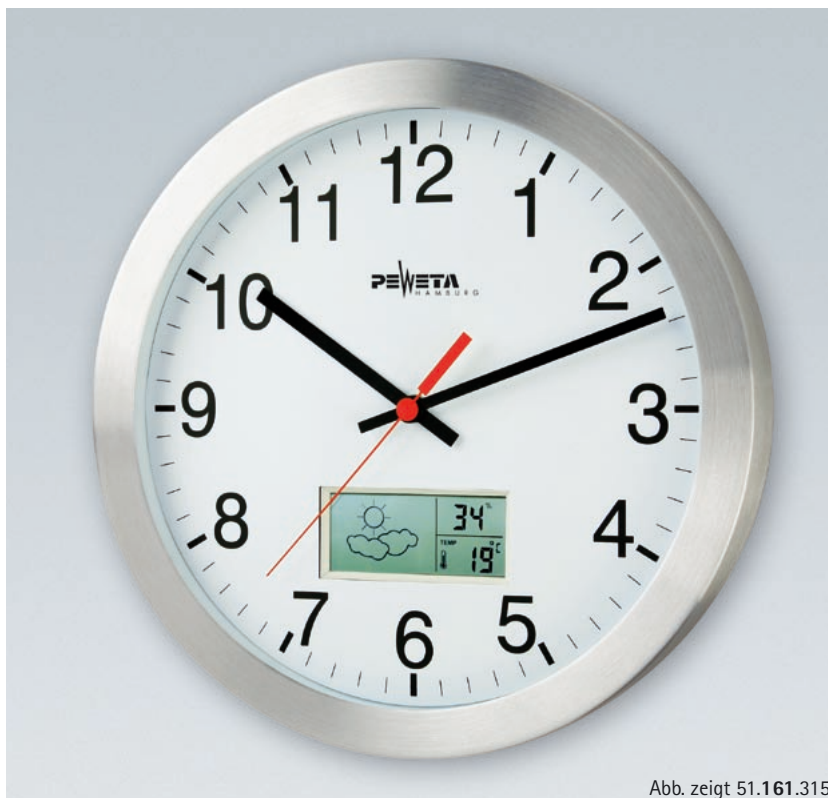
Abb. zeigt 51.161.315

schwarze Balkenzeiger für Stunden- und Minutenanzeige, schwarzer bzw. roter Sekundenzeiger.