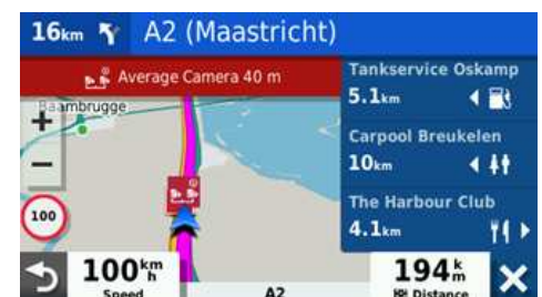
POIs entlang der Route und Radarwarner