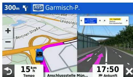
3D-Kreuzungsansicht und Fahrspuranzeige