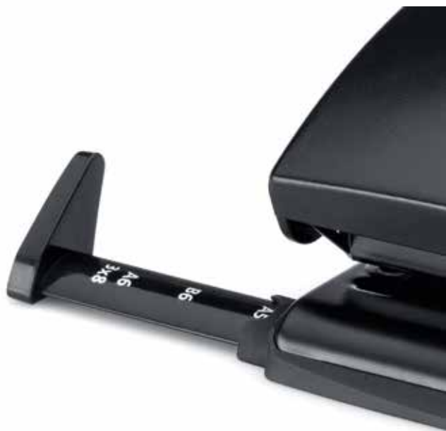
Sicher einrastende Anschlagsschiene mit gut ablesbarer Formatanzeige