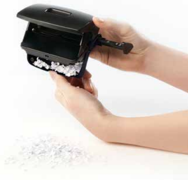
Der geteilt aufklappbare Locherboden bietet hohen Komfort beim Entleeren des Gerätes.