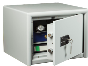
CL 20 S