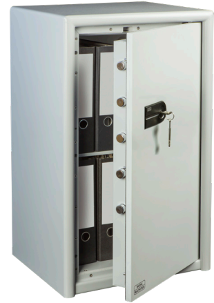
CL 60 S