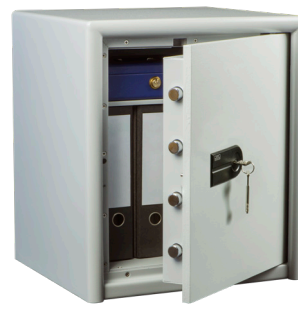
CL 40 S