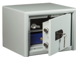
CL 10 S